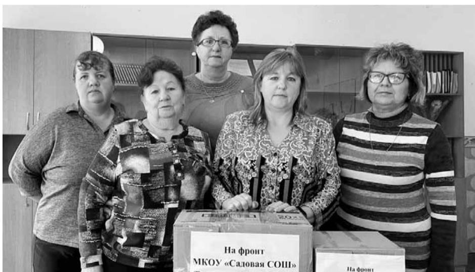
Посылки на фронт от коллектива Садовой средней школы Третьяковского района