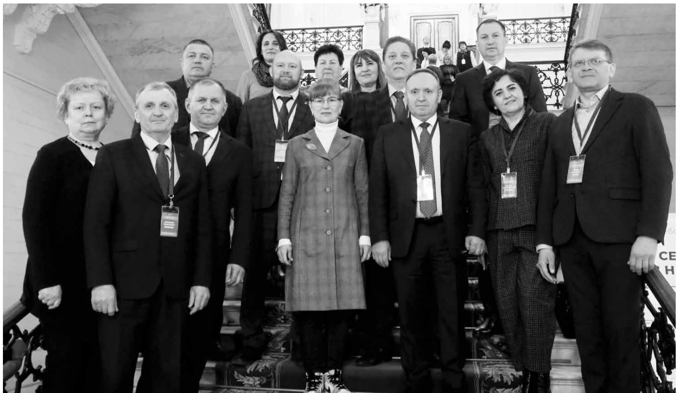
Встреча во Дворце труда

Для открытия стажировки было выбрано уникальное место - Николаевский дворец, который когда-то служил резиденцией великого князя Николая Николаевича, а с 1918 года перешел в распоряжение профсоюзов и теперь известен во всем мире как Дворец труда. Впрочем, многие школы, гимназии, лицеи города находятся в зданиях, имеющих историческую ценность. Такое «бытие» в историческом антураже, как показывает практика, определяет сознание и педагогов, и учеников. Но, несмотря на любовь к истории и умение сохранять традиции, образовательная система Санкт-Петербурга задает тон и формирует тренды инновационного развития.