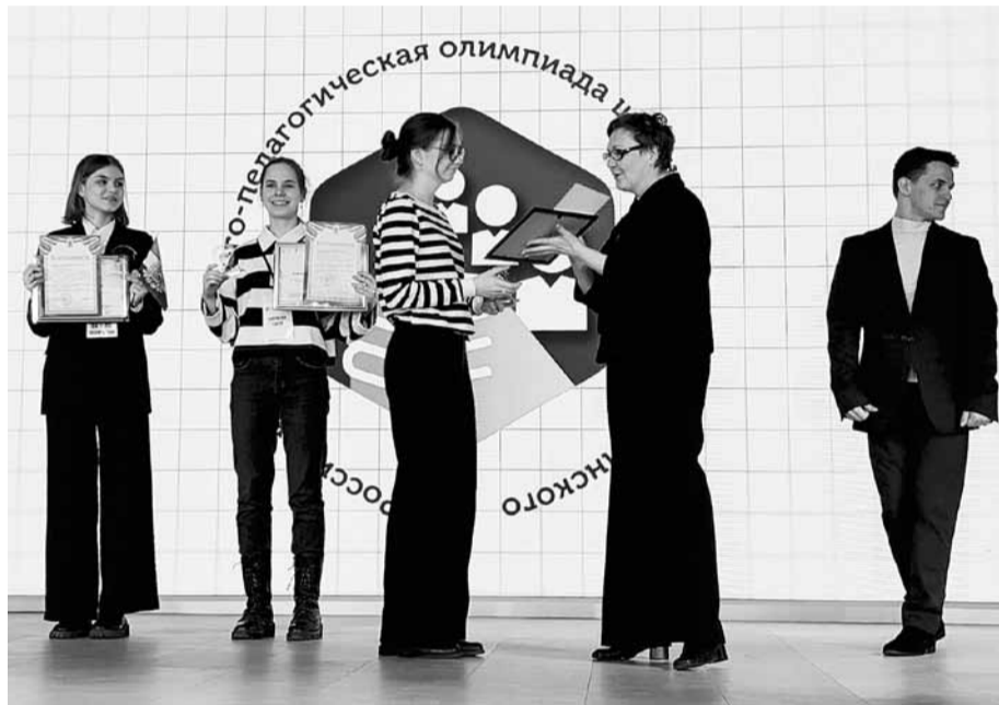
Ирина ЛОБОДА награждает победителей

И вдруг эти молчаливые дети стали говорить интересно и полно! Вот что значит настроить на тему и хорошо сформулировать вопрос.