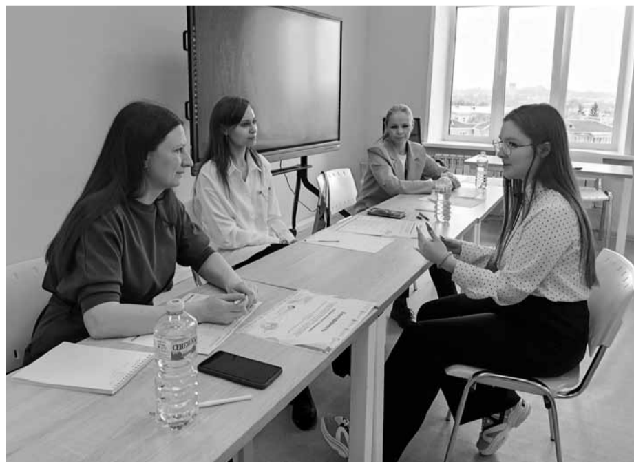
Беседа с доброжелательным жюри

Каждый олимпиадник независимо от того, в 9-м, 10-м или 11-м классе он учится, должен был пройти письменный тур с тестовыми и ситуационными заданиями. И устный тур, на котором нужно было в течение 30 минут подготовить и за 10 минут показать фрагмент занятия профориентационного курса «Россия - мои горизонты». Тема вытягивается по жребию. Статисты для уроков - ученики ярославских школ. Возраст тот же, что и у «педагога»-конкурсанта.