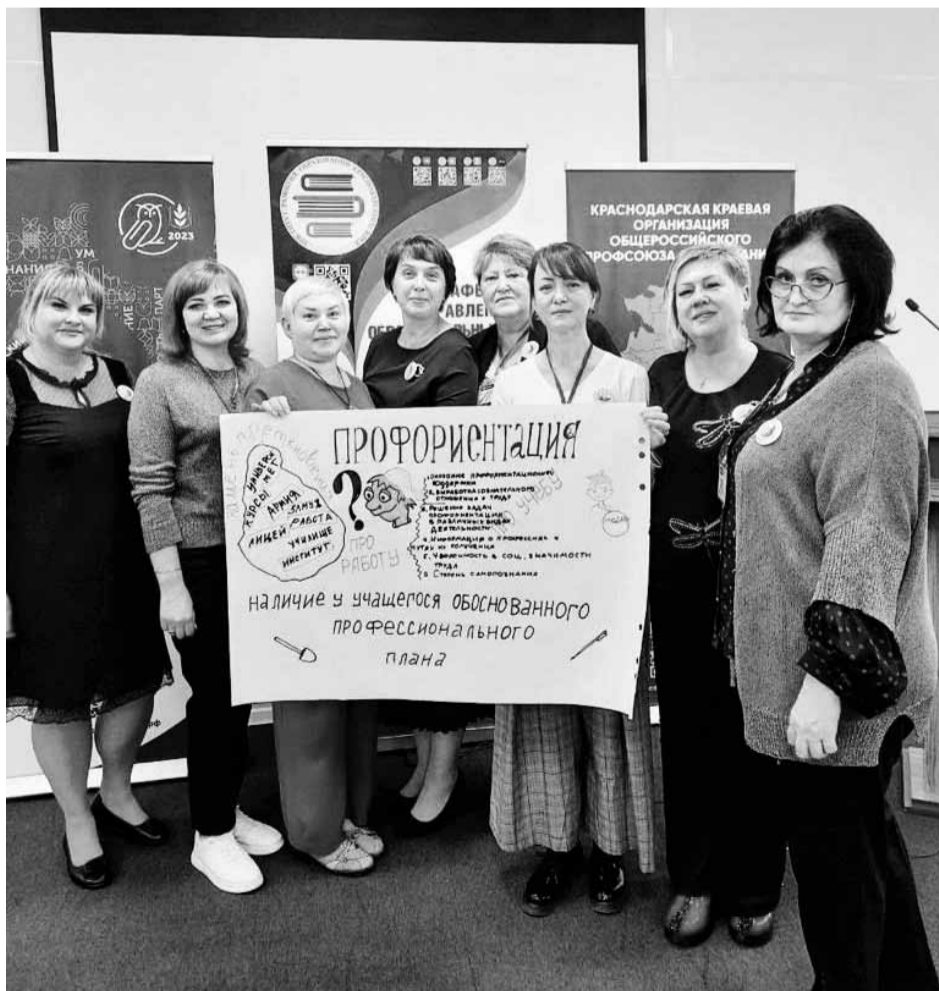
Второй краевой форум «Флагманы образования. Директор»

Ежегодно список обучающих мероприятий в «Рассвете» пополняется и расширяется тематически. На сезон 2024 года, в мае и октябре, уже запланировано 20 образовательных выездов! Первый - «Советники. Старт в лето» - стартует 30 апреля, а замыкающим станет семинар «Наставники Кубани. Маршрут построен», который завершится 31 октября.