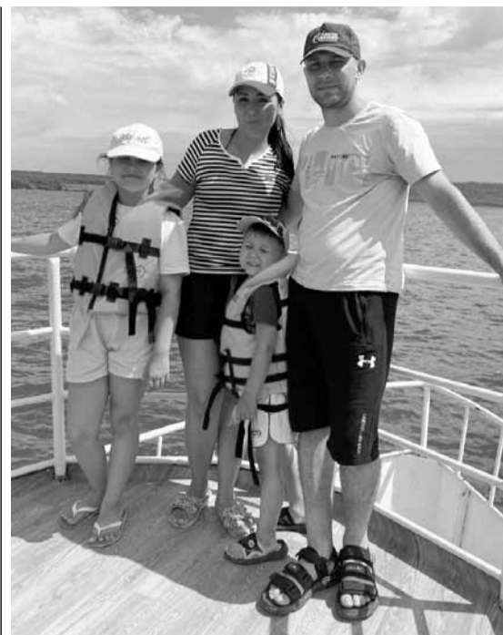
Путешествие в Башкирию

Алатырский муниципальный округ, Чувашская Республика