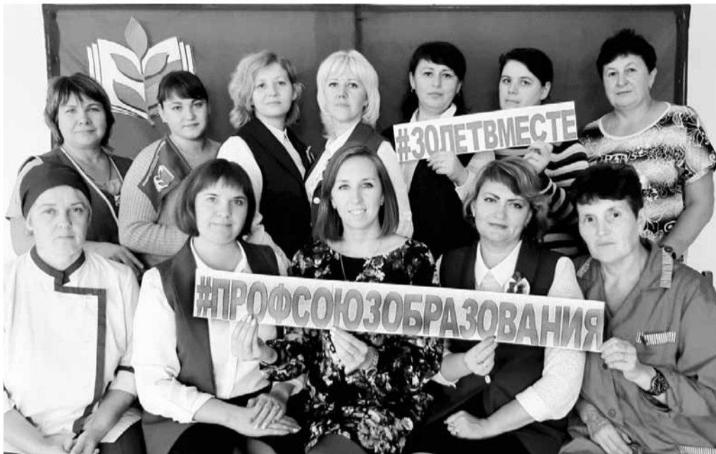
Первичка детского сада