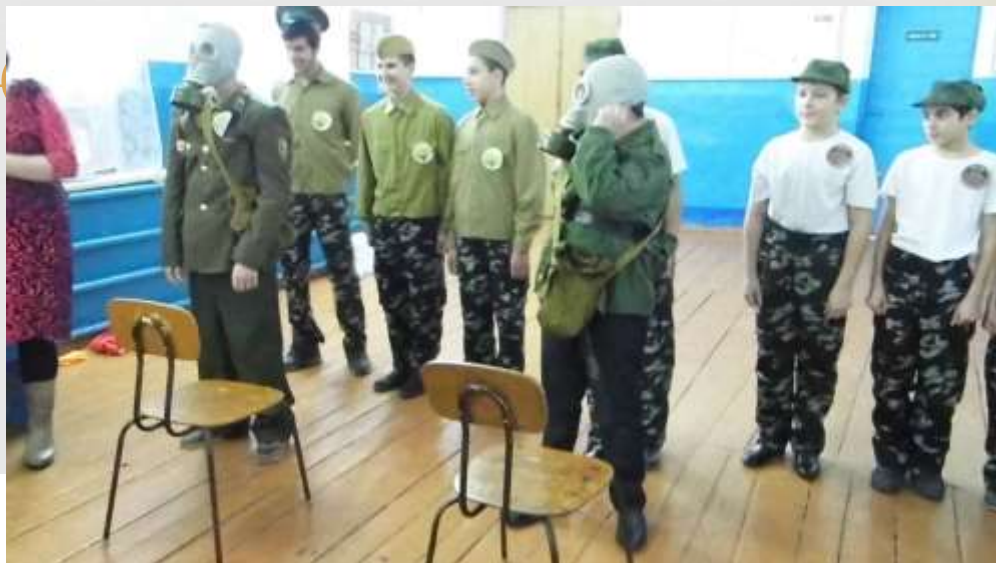
Командная игра «А ну ка, парни!»