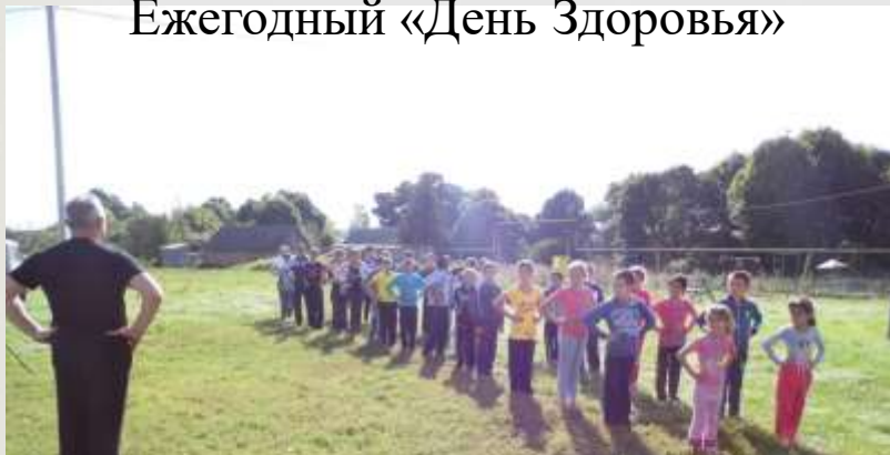
Ежегодный «День Здоровья»