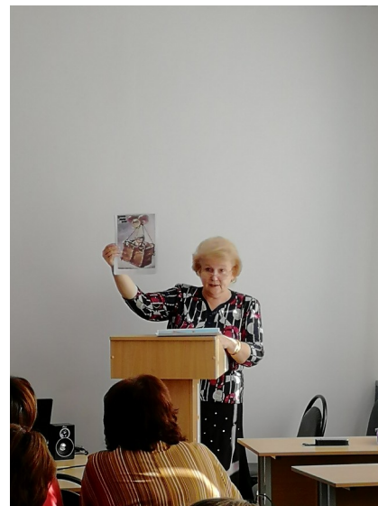
Старший методист, руководитель отдела иностранных языков